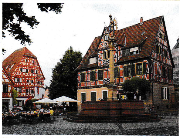
Der historische Ladenburger Ortskern