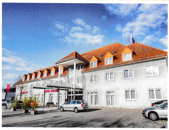
Unser Treffpunkt: Das Leonardo Hotel