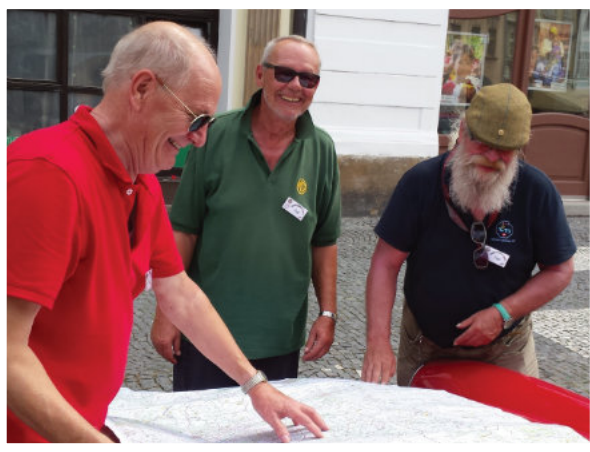
Old School Routenplanung war gestern ...