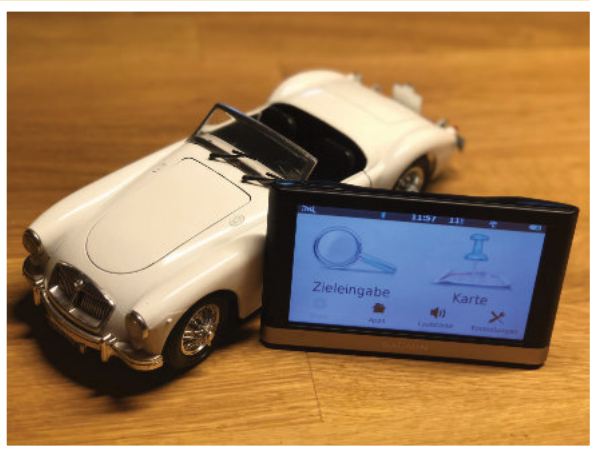
Dein Navi – das (noch) unbekannte Wesen !