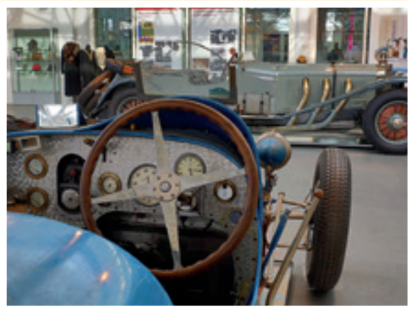
Könnte klappen: Besuch der Central Garage in Bad Homburg