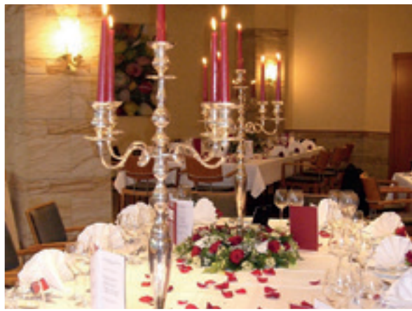
...und wir ändern uns mit den Zeiten: „Fine Dining“...