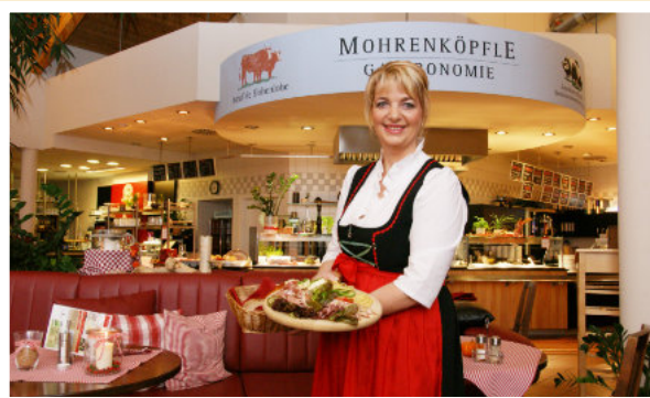
Hohenloher Spezialitäten auf dem Bauernmarkt