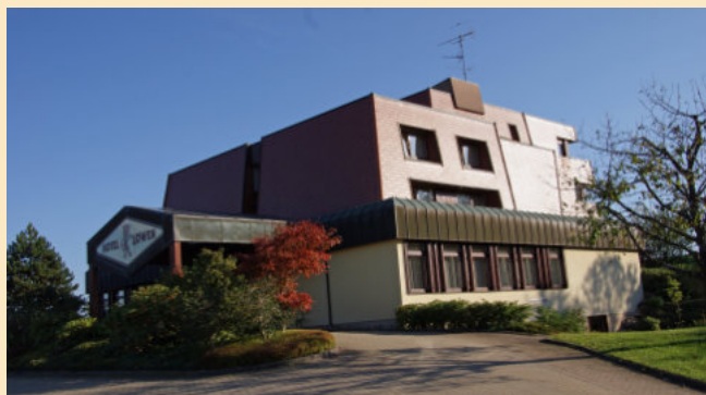
Das MG Quartier: Hotel Löwen in Mainhardt

Einen interessanten Einblick in die Zukunft der Raumfahrt bietet die Forschungsstätte des DLR in Lampoldshausen.