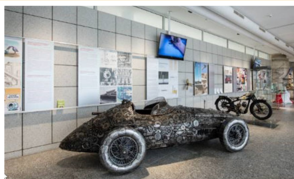
Besonders: Schrauben- und Kunstmuseum Würth