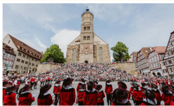
Mittelalter zum Anfassen: Schwäbisch Hall