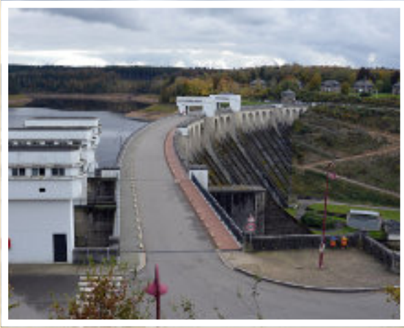
Etappe Samstag: Ostbelgien und "Dutch Mountains"