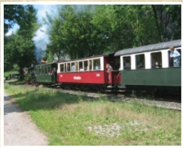
Special am Montag: Eisenbahn-Romantik erleben