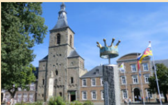
Unser Basislager: die Abtei Rolduc in Kerkrade (NL)

Wir freuen uns auf ein erlebnisreiches Wochenende mit MG-Freundinnen und -Freunden aus allen Ländern!