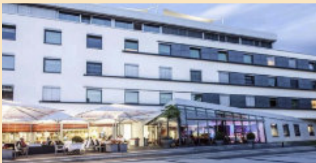
Das MG Quartier: Leonardo Hotel in Esslingen

Wir, das Orga Team, freuen uns auf ein Wiedersehen mit unseren MG Freunden von nah und fern.